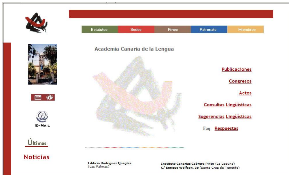
Aspecto de la página de inicio (24 de Junio de 2007)

La actualización permanente de la página Web es tan crucial como su existencia. El servicio externo que estaba ocupándose de esta tarea ha dejado de hacerlo, por lo que es imperioso buscar uno nuevo que lo sustituya.