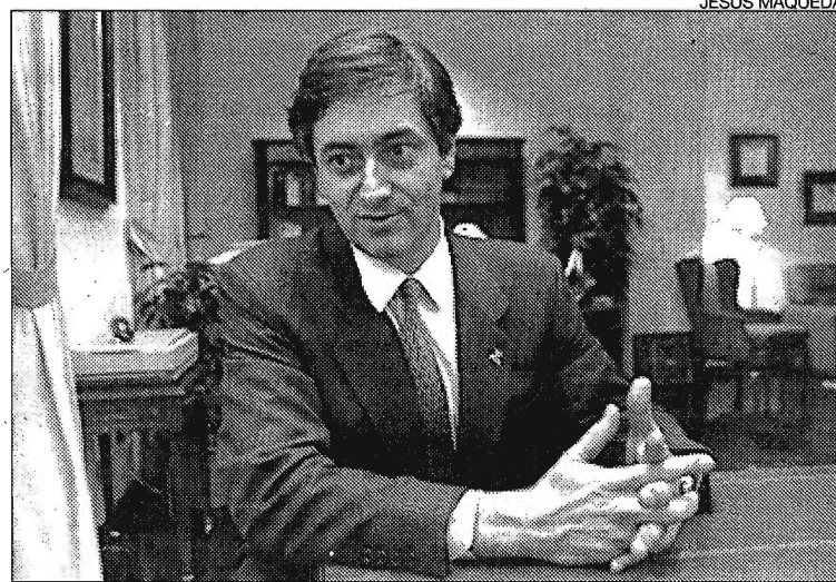
La revisión del Estatuto de Autonomía figura entre las prioridades de Machado.

● "Todas las autonomías deberían tener una delegación en Madrid, porque hay muchísimas competencias que hay que coordinar"