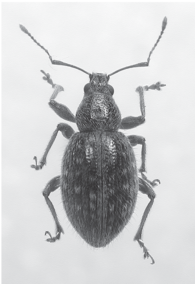
Figura 1. Laparocerus bacalladoi n.sp., ejemplar macho.

dibujo en damero más o menos preciso. En los élitros emerge un campo abierto de pelos erectos, muy finos y largos –tanto o más que la longitud del oniquio– que, a la lupa, confieren un aspecto hirsuto al animal.