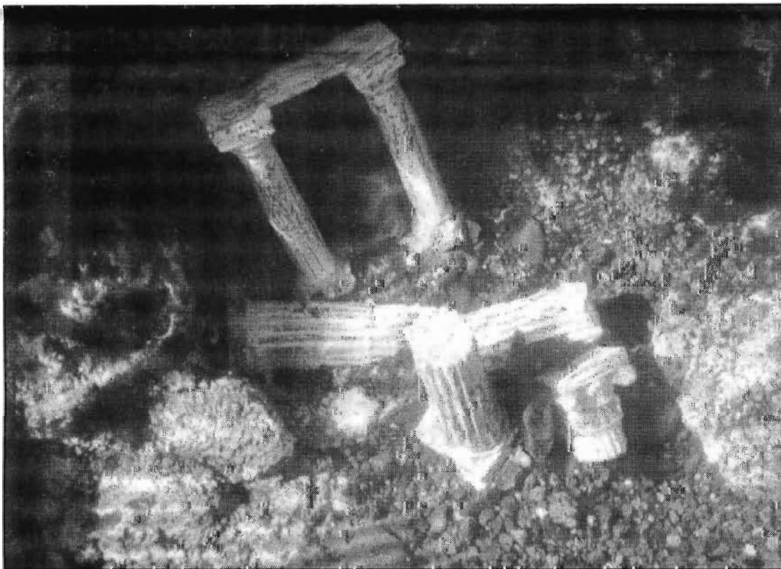
Ruinas de la Atlántida en los fondos marinos de La Punta, al pie del Roque Dos Hermanos

"Era el jueves o el martes, no sé, y largué la pandorga en un sitio que yo me sé -indicó- y, oiga, a la primera va y se me traba en el fondo. Venga a tirar pa'arriba y nada. En eso agarro el mirafondo de un tío mío que me lo prestó y ¡óigame!, que este servidor no se lo podía creer: mire, como en las películas de romanos. Unos postes como si fueran columnas dóricas. Y lo raro, mire usted, es que ese fondo lo conozco yo desde que era así y nunca lo había visto. Se ve que se metió una plaga de erizos negros de punta larga, de esos que pelan todo por donde pasas. Por eso ahora se