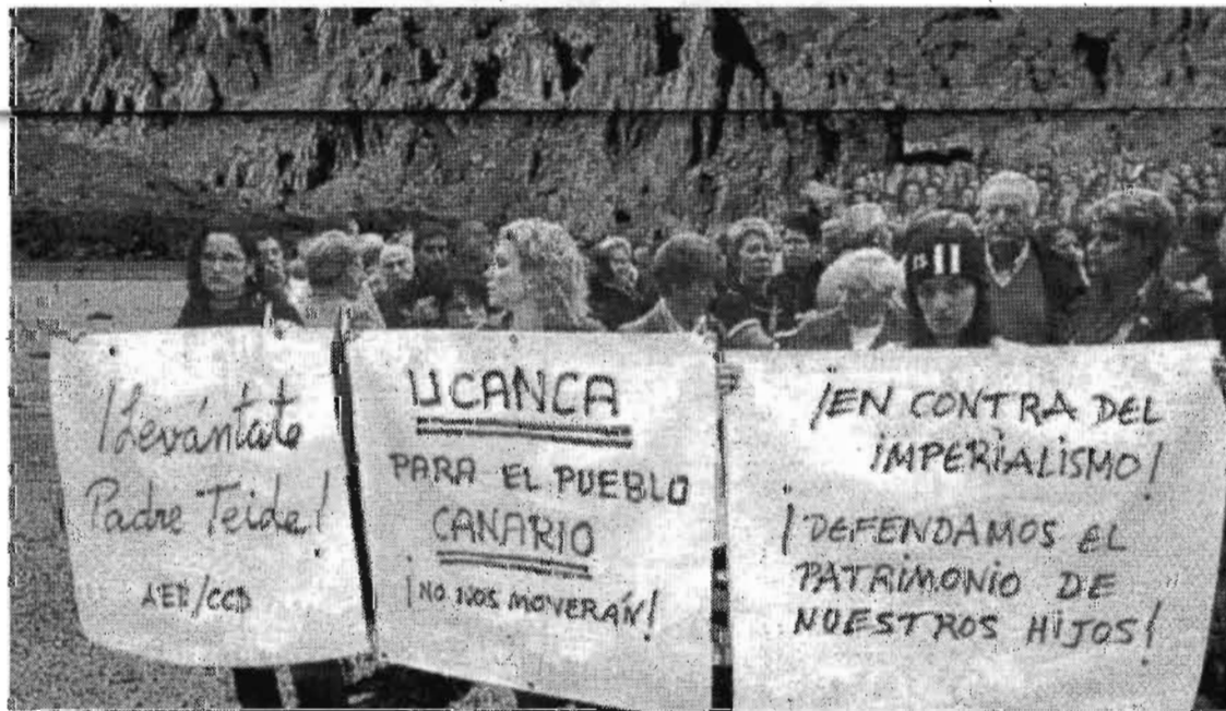
Manifestación anti-Parque Jurásico en el Valle de Ucanca.