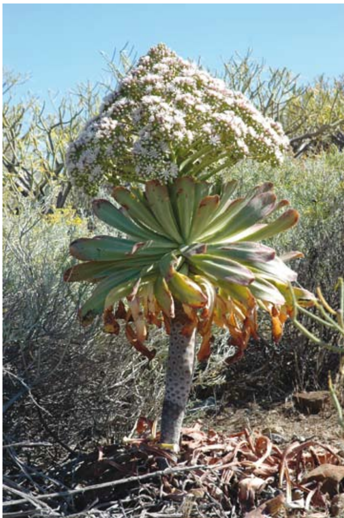
El aislamiento de las islas oceánicas ha propiciado la formación de muchos endemismos. Bejueque endémico de la isla de Tenerife.

la que suele pasar inadvertida, la provocan las especies invasoras introducidas involuntariamente. Es prácticamente imposible revertir la situación, y a lo sumo podemos aspirar a reparar algo del daño causado. Lo que, en principio, sí está en nuestras manos, es no sacrificar más biodiversidad y evitar los impactos innecesarios de cara al futuro. Este es el reto del desarrollo sostenible en cualquier sociedad moderna, sólo que en las islas adquiere un matiz especial. En cierta ocasión, y refiriéndome a mi tierra, escribía: “Canarias no puede ser homologada a un territorio cualquiera. Desarrollar en Canarias es como jugar a la pelota en una tienda de porcelana. Es una cuestión de ciencias naturales, no de chauvinismo” (Machado, 1992). La metáfora es apli-