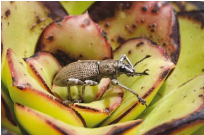
El número de endemismos en islas oceánicas es siempre elevado, particularmente en insectos. Herpisticus , género de gorgojo endémico de las islas Canarias.

nueva tecnología en la que esta audiencia está implicada: la conservación (de la naturaleza), con sus luces y sus sombras.